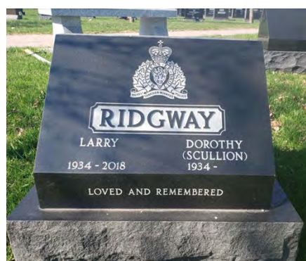
Lot de crémation avec monument